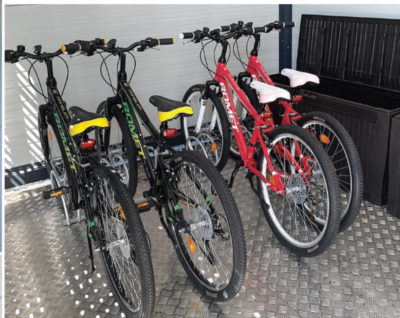
Občinska uprava Občine Destrnik