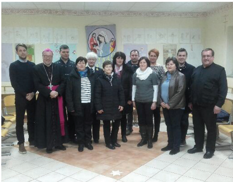
srečanje s člani Župnijskega pastoralnega sveta

Vizitator, gospod nadškof metropolit msgr. Alojzij Cvikel, je program kanonične vizitacije, ki smo ga pripravili na seji