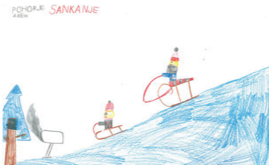
Timotej Vuk, 1. a